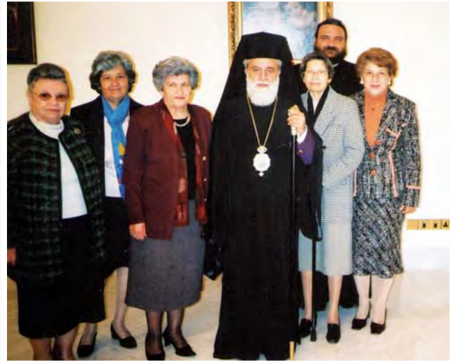
Η πρόεδρος και μέλη της Π.Α.Ε.Κ. έχουν κάμει εισφορά για τον ταλανιζόμενο λαό της Ινδονησίας στον Πανιερώτατο Μητροπολίτη Κύκκου και Τηλλυρίας κ. Νικηφόρο.