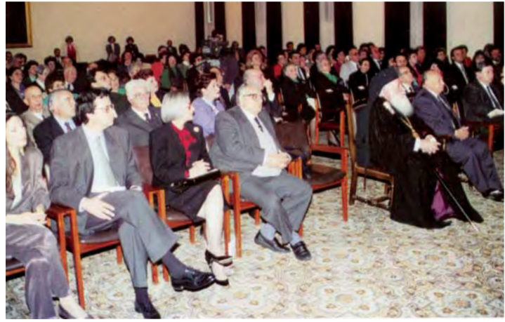
Την επέτειο της Διεθνούς Ημέρας της Γυναίκας, η Π.Α.Ε.Κ. οργάνωσε τιμητική εκδήλωση για την Υπουργό Παιδείας κ. Κλαίρη Αγγελίδου. Ο Πρόεδρος της Δημοκρατίας κ. Γλαύκος Κληρίδης επιδίδει το τιμητικό δίπλωμα στην Τιμωμένη (9.3.1994). Δεξιά: Αποψη του ακροατηρίου.