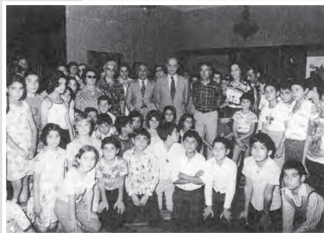
Παιδιά του προσφυγικού συνοικισμού Βρυσούλων που φιλοξενήθηκαν στην Παναγία Σουμελά στη Μακεδονία από το Σύνδεσμο Φιλίας Ελλάς-Κύπρος με την μεσολάβηση της Π.Α.Ε.Κ. (1976).