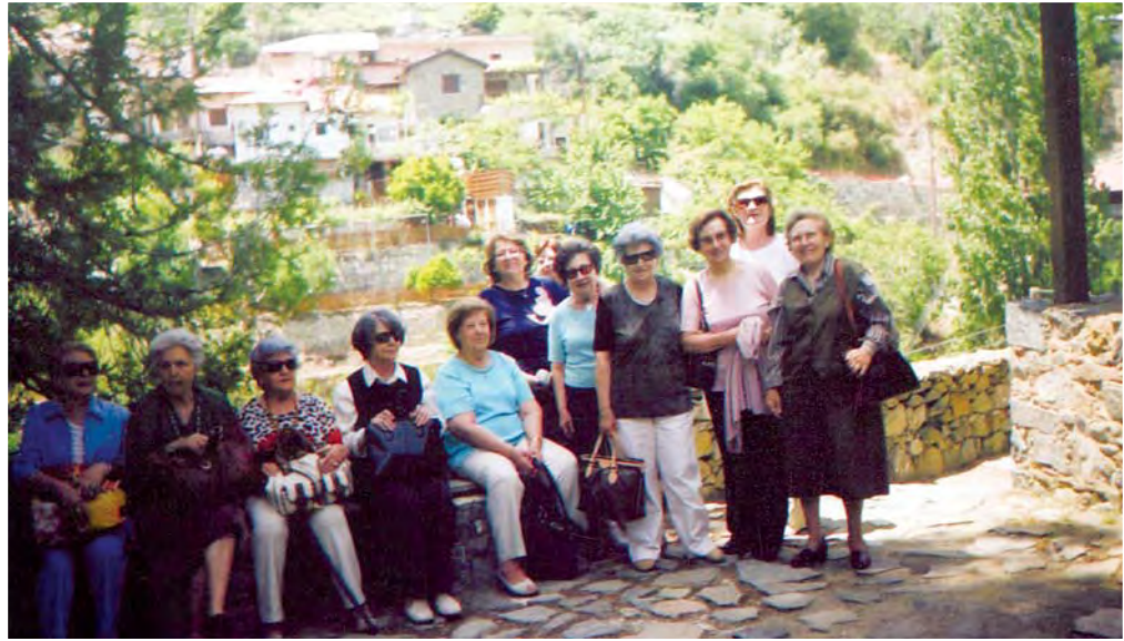
Εκδρομή της Π.Α.Ε.Κ. στο μοναστήρι του Αγίου Ιωάννη του Λαμπαδιστή στον Καλοπαναγιώτη (19.05.2009)