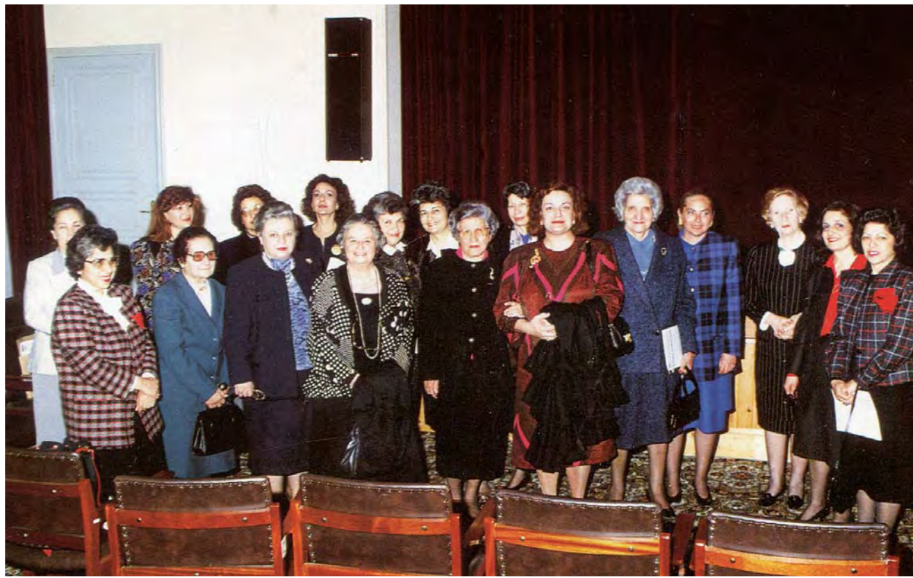
Στην επέτειο της Διεθνούς Ημέρας της Γυναίκας (08.03.1990) ομιλήτρια ήταν η κ. Μαριέττα Γιαννάκου Κουτσίκου. Αναμνηστική φωτογραφία της ομιλήτριας με την πρόεδρο και το Διοικητικό Συμβούλιο της Π.Α.Ε.Κ.