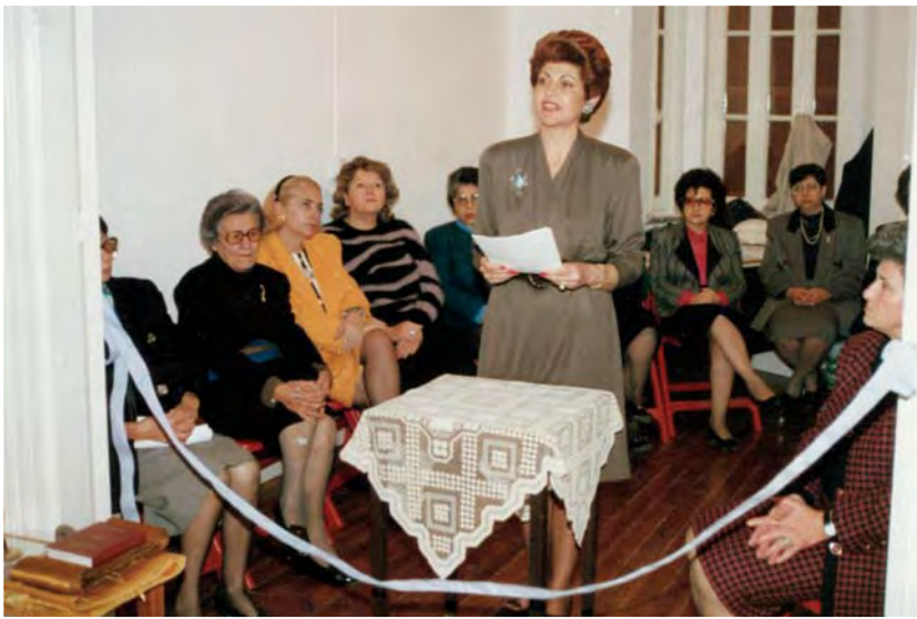
Η σύζυγος του Προέδρου της Κυπριακής Δημοκρατίας κ. Ανδρούλα Βασιλείου εγκαινιάζει τη Μαθητική Εστία Φανερωμένης (1992).