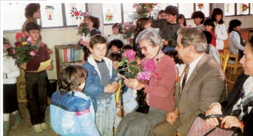
Χριστουγεννιάτικη επίσκεψη του σωματείου στο ακριτικό χωριό Δένεια. Μετά τη γιορτή και τη διανομή των δώρων, τα παιδιά προσφέρουν άνθη στην πρόεδρο της Π.Α.Ε.Κ.