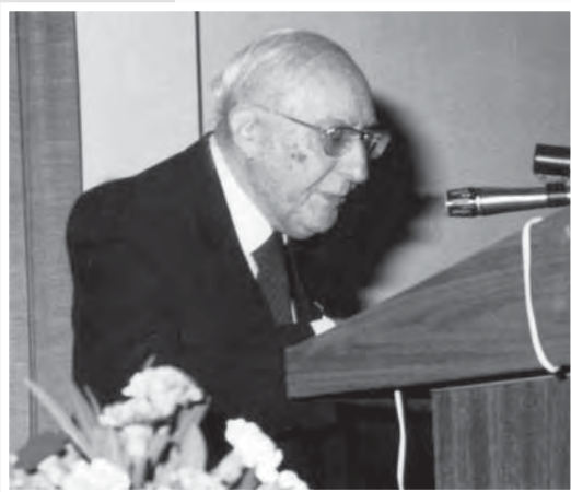
Το σωματείο τίμησε σε ειδική συγκέντρωση τον λυρικό ποιητή, αείμνηστο Ξάνθο Λυσιώτη (1986).