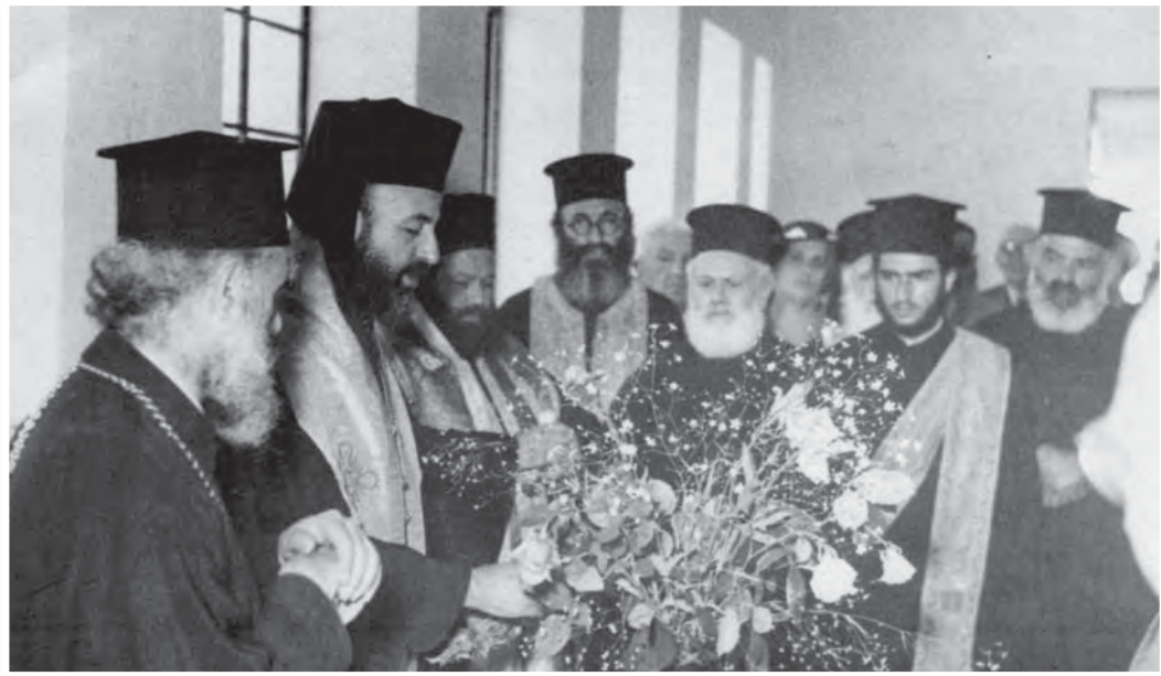
Αγιασμός στα εγκαίνια της Σεβερείου Παιδικής Εξοχής Λευκωσίας από τον Αρχιεπίσκοπο Μακάριο Γ' (Μάιος 1953).