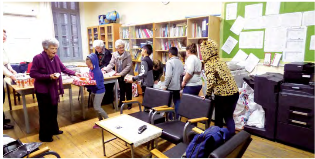
Η πρόεδρος και μέλη της Π.Α.Ε.Κ. προσφέρουν χριστουγεννιάτικα δώρα στα παιδιά του Δημοτικού Φανερωμένης (2016).