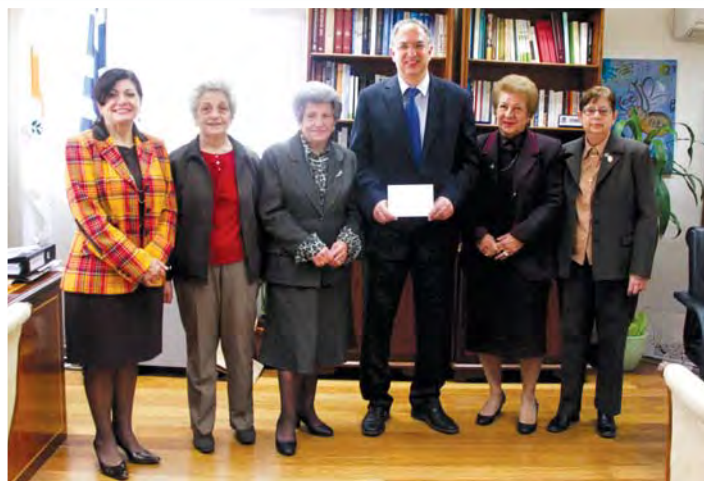
Αναμνηστική φωτογραφία από την επίσκεψη της Π.Α.Ε.Κ. στο Υπουργείο Παιδείας και Πολιτισμού.