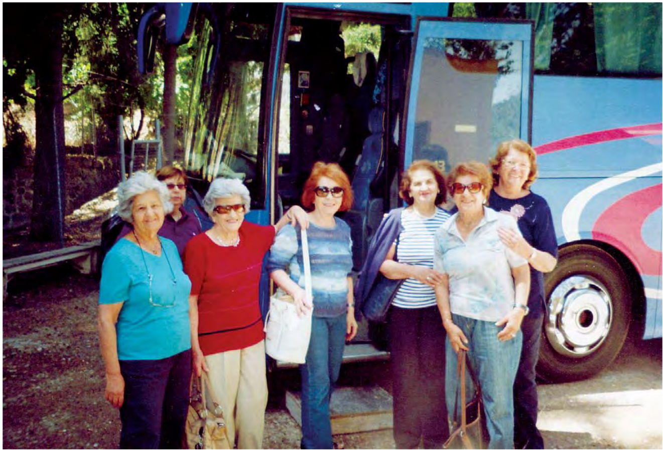
Εκδρομή στο Παλαιχώρι.