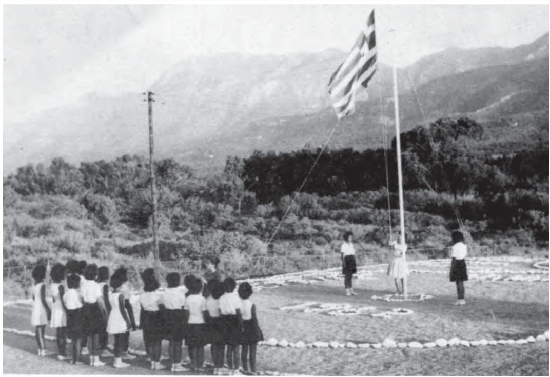
Έπαρση της σημαίας μπροστά στο βωμό. Πίσω ο σκλαβωμένος τώρα Πενταδάκτυλος, Γλυκιώτισσα 1962.