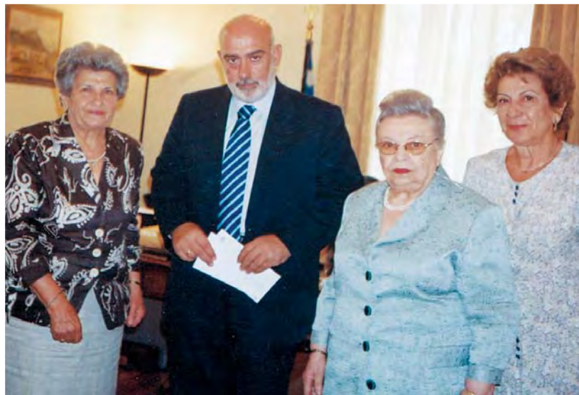
Εισφορά από την Π.Α.Ε.Κ. στον Έλληνα πρέσβη για τους Πυροπλήκτους της Ηλείας.