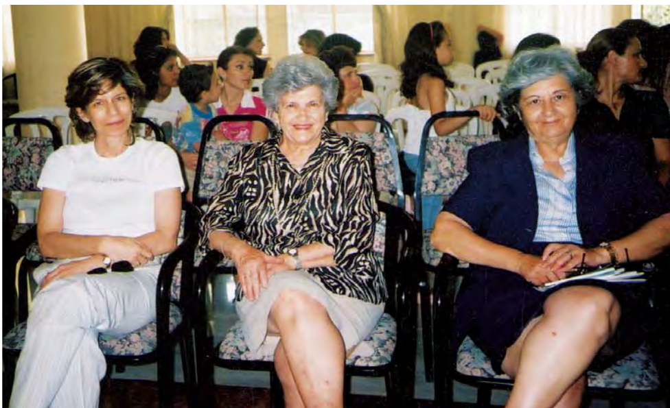
Παιδιά της Μαθητικής Εστίας γευματίζουν στην κατοικία του Έλληνα πρέσβη. Στη φωτογραφία, η πρόεδρος και μέλη του Διοικητικού Συμβουλίου της Π.Α.Ε.Κ.