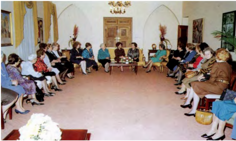
Στιγμιότυπο από την φιλοξενία των μελών του Συνδέσμου Φιλίας Ελλάς-Κύπρος στο Προεδρικό Μέγαρο από την κ. Ανδρούλα Βασιλείου, σύζυγο του Προέδρου της Δημοκρατίας. Μαζί τους η πρόεδρος και το Διοικητικό Συμβούλιο της Π.Α.Ε.Κ. (Νοέμβριος 1991).