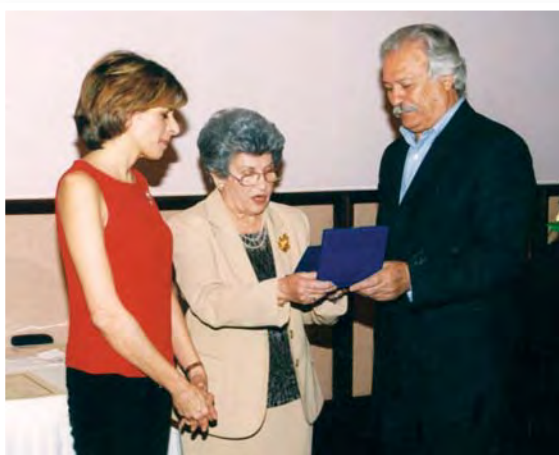
Η πρόεδρος της Π.Α.Ε.Κ. τίμησε την κ. Στέλλα Κυριακίδου, πρόεδρο της Ευγορα Donna. Την τιμητική πλακέτα επιδίδει ο Υπουργός Δικαιοσύνης και Δημοσίας Τάξεως κ. Νίκος Κόσιης (6.3.2002).