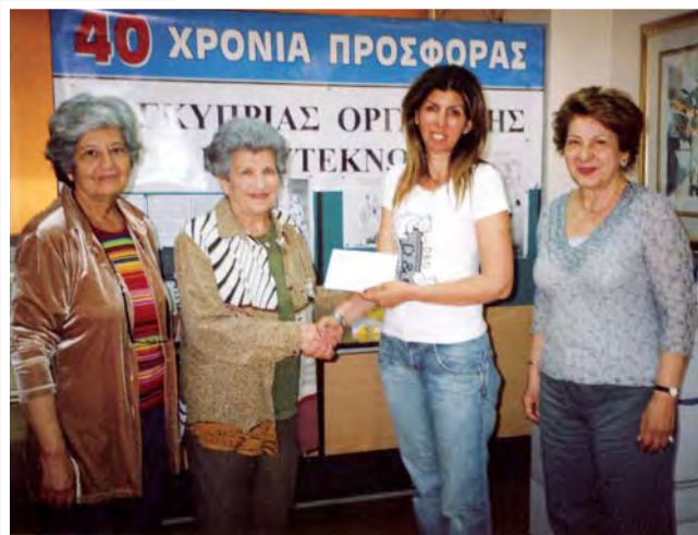
Η πρόεδρος και μέλη της Π.Α.Ε.Κ. επισκέφθηκαν την Επαρχιακή Επιτροπή Πολυτέκνων και έκαναν εισφορά (€1000) - είσπραξη από πασχαλινό παζαράκι.