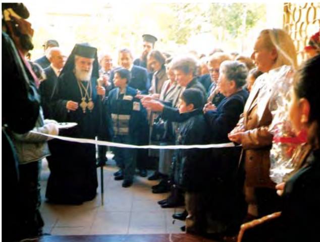
Ο Πανιερώτατος Μητροπολίτης Κύκκου και Τηλλυρίας κ. Νικηφόρος εγκαινιάζει το χριστουγεννιάτικο παζαράκι του Σωματείου.