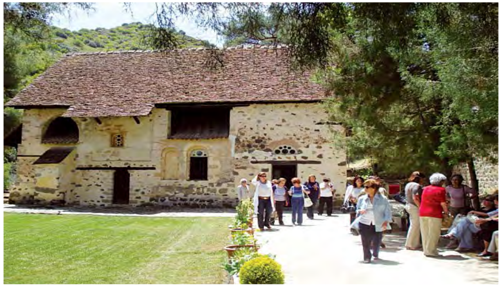
Εκδρομή στην εκκλησία του Αγίου Νικολάου Στέγης στην Κακοπετριά (06.06.2013).