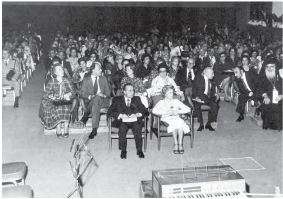
Άποψη του ακροατηρίου.