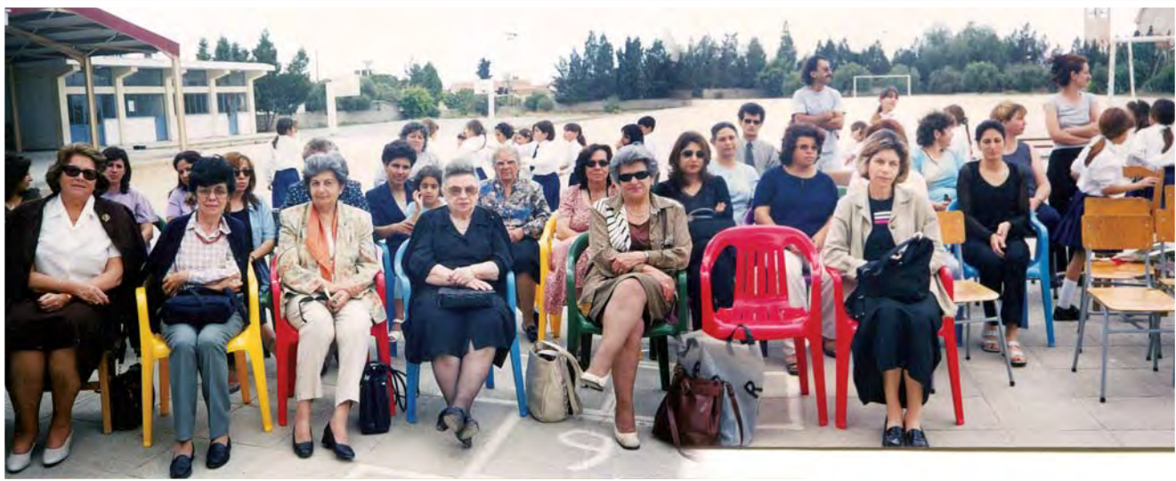
Στιγμιότυπα από την Γιορτή της Μητέρας που οργάνωσε το Σωματείο στο Δημοτικό Σχολείο Βρυσούλων (2007). Στο βάθος το εκκλησάκι της Παναγίας Σουμελά που έκτισαν τα προσφυγόπουλα, σε ανάμνηση της φιλοξενίας τους από τον Σύνδεσμο Φιλίας Ελλάς-Κύπρος, με τη μεσολάβηση της Π.Α.Ε.Κ, στην Παναγία Σουμελά.