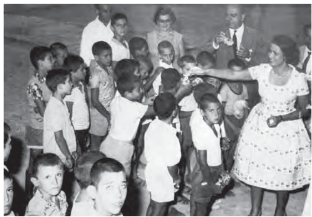
Από την επίσκεψη του πρέσβη κ. Τρανού στην Παιδική Εξοχή, 1962.