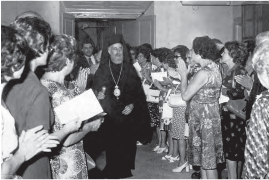
Ο Μακαριώτατος προσέρχεται στην τελετή παράδοσης της Περγαμηνής της Κύπρου, επευφημούμενος από τις Γυναίκες (Ιούλιος 1975).