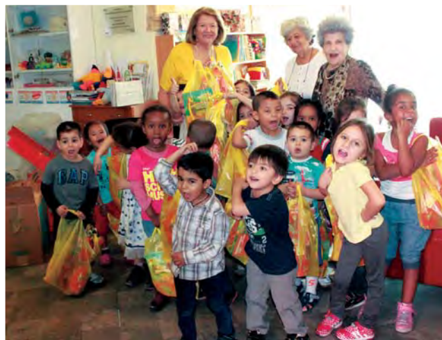
Η Π.Α.Ε.Κ. μοιράζει δώρα στα παιδάκια του Νηπιαγωγείου Φανερωμένης.