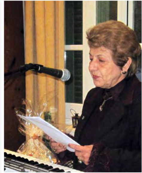
Στιγμιότυπο από την εκδήλωση «Χριστουγεννιάτικο Απόγευμα» (17.12.2014).