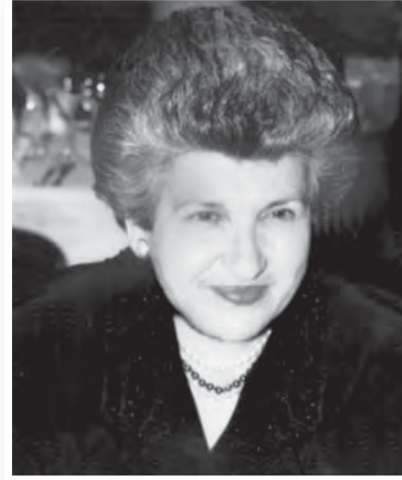
ΤΖΙΑΝΤΑ ΚΩΝΣΤΑΝΤΙΝΙΔΟΥ τέταρτη πρόεδρος από το 1999