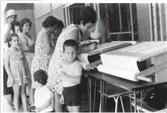
Πρόσφυγες υπογράφουν την Περγαμινή.