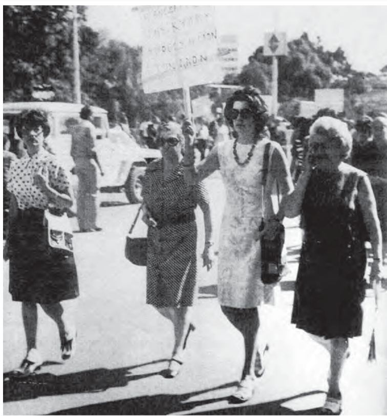
Μέλη του Διοικητικού Συμβουλίου της Π.Α.Ε.Κ. μετέχουν στην «Πορεία Γυναικών προς την Αμμόχωστο» (20.4.1975).