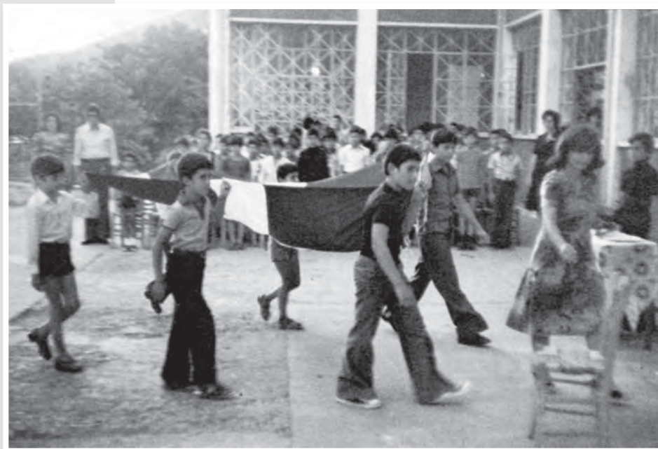
Από την έπαρση της σημαίας στη Σχολή Μιτσή Λεμύθου (1967), όπου λειτουργούσε η Παιδική εξοχή Λευκωσίας.