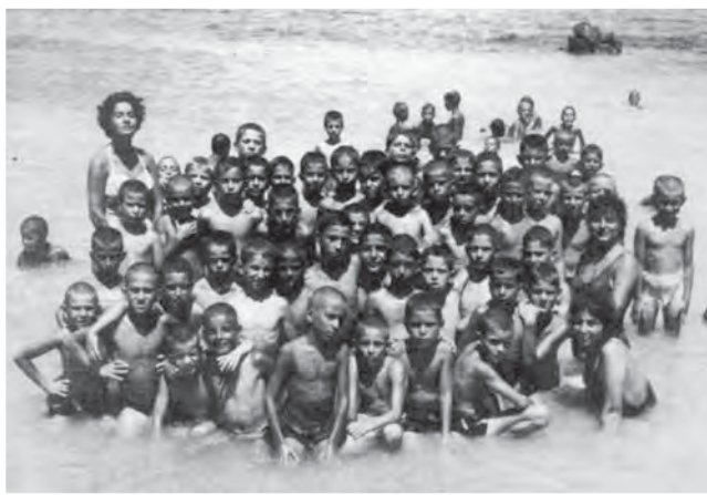
Χαρούμενα κουρεμένα κεφάλια στον κόλπο της Γλυκιώτισσας.