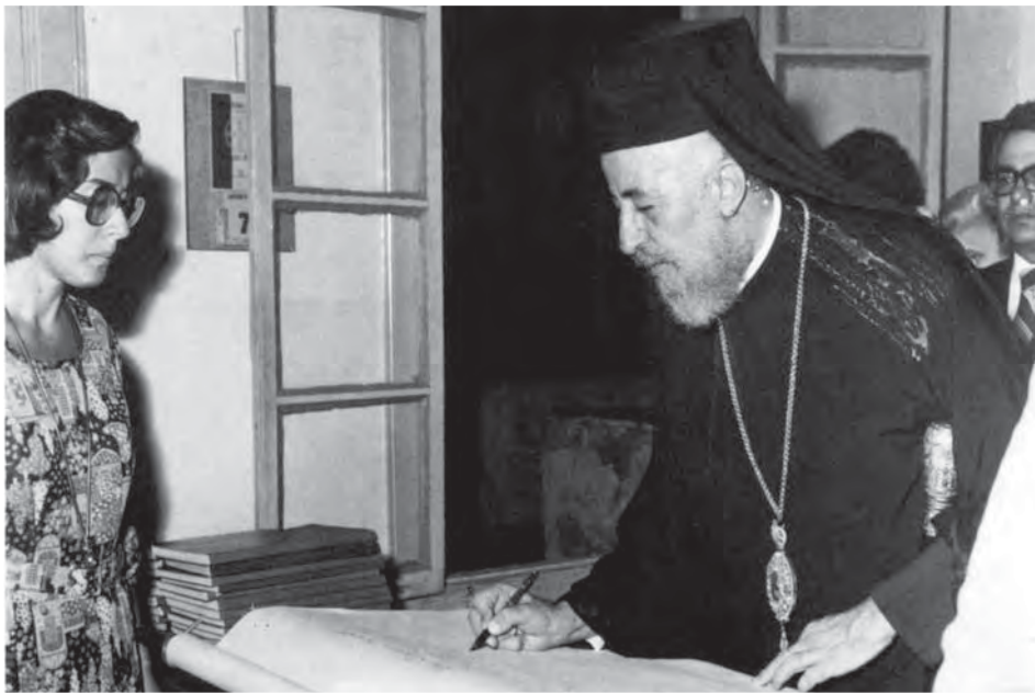
Ο Μακαριώτατος υπογράφει την Περγαμηνή της Κύπρου.