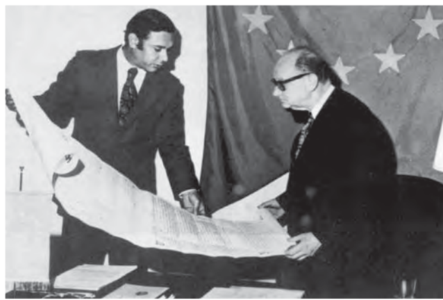
Κομμάτι της Περγαμινής της Κύπρου.