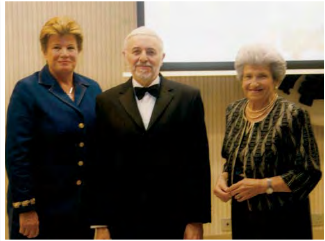
Η σύζυγος του Προέδρου της Κυπριακής Δημοκρατίας κ. Άντρη Αναστασιάδη με τον τιμηθέντα.