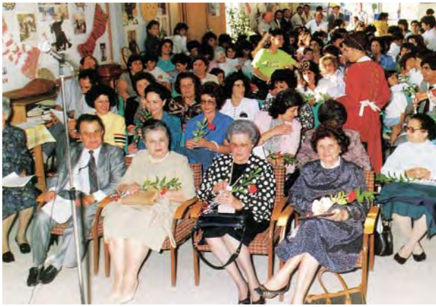
Στιγμιότυπο από την ίδια εκδήλωση. Στις πρώτες σειρές οι κυρίες του Διοικητικού Συμβουλίου κρατώντας τα λουλούδια που τους προσέφεραν τα παιδιά.