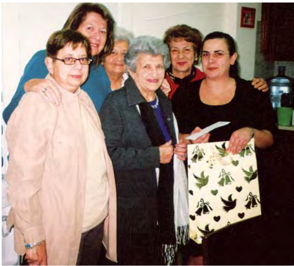
Η πρόεδρος και μέλη του Διοικητικού Συμβουλίου της Π.Α.Ε.Κ. έκαναν εισφορά για τις ανάγκες του Συνδέσμου Αυτιστικών.