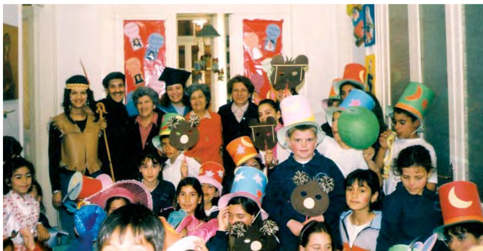
Παιδιά της Μαθητικής Εστίας Φανερωμένης με τις δασκάλες τους σε καρναβαλίστικο πάρτι.