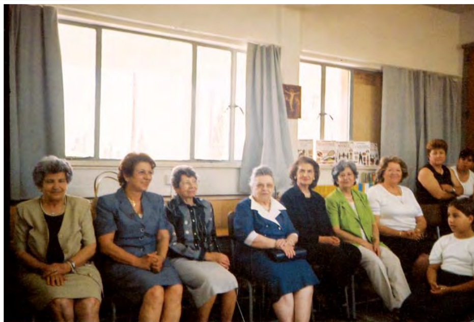
Στιγμιότυπα από τη γιορτή της Μητέρας που γιόρτασε η Π.Α.Ε.Κ. με τα παιδιά του Δημοτικού Σχολείου Δένειας.