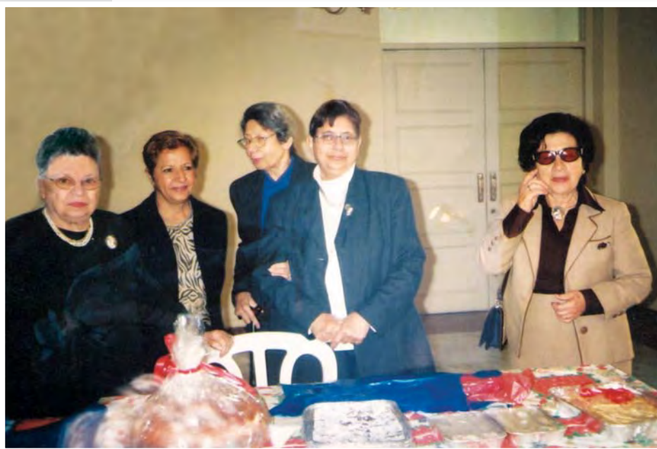
Πασχαλινό παζαράκι για τις ανάγκες της Μαθητικής Εστίας Φανερωμένης.