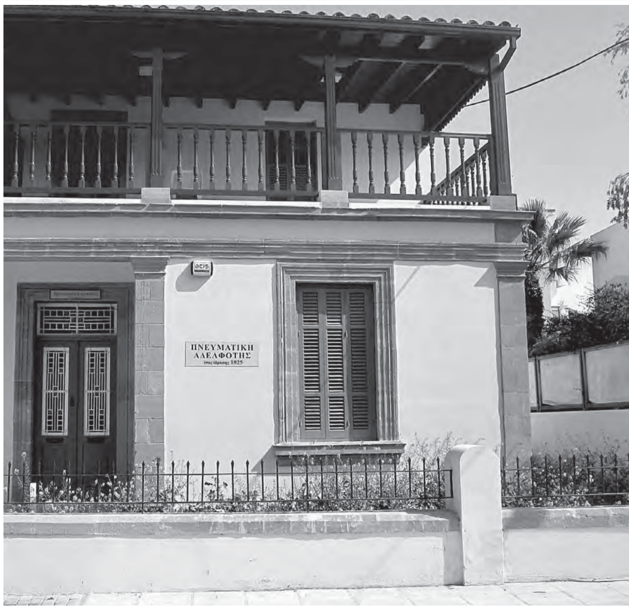
Πρόσοψη του οικήματος του σωματείου «Πνευματική Αδελφότης Ελληνίδων Κύπρου».