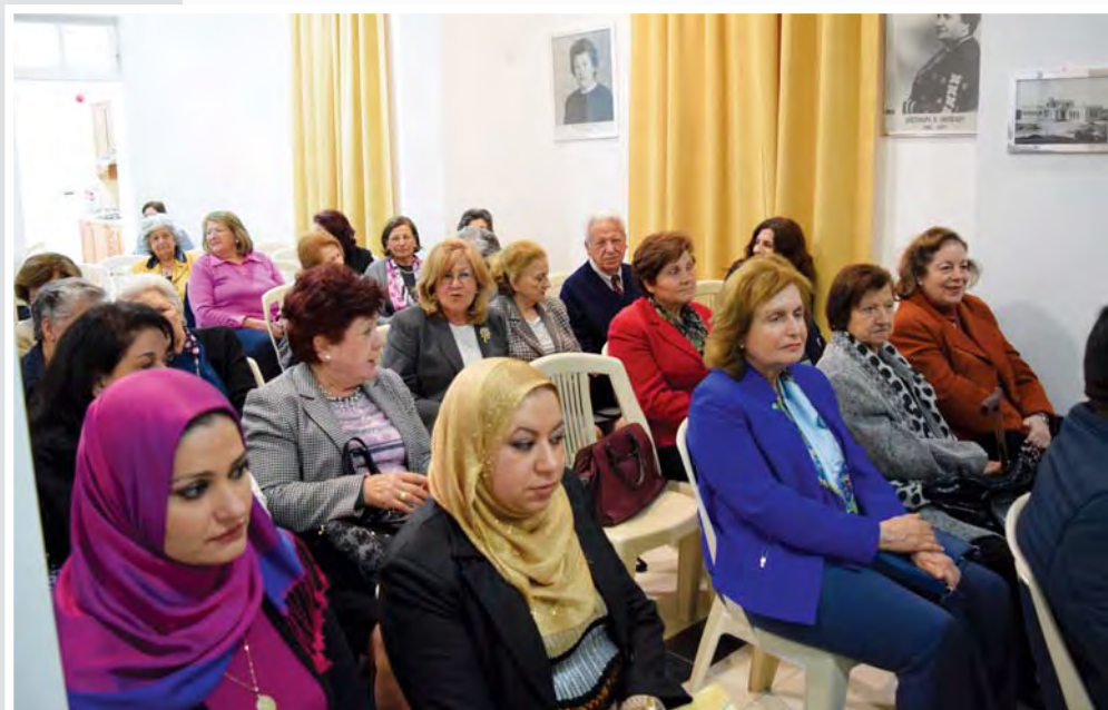
Άποψη του ακροατηρίου στην εκδήλωση. Στη φωτογραφία η τιμηθείσα από την Π.Α.Ε.Κ. Παλαιστίνια πρόσφυγας.