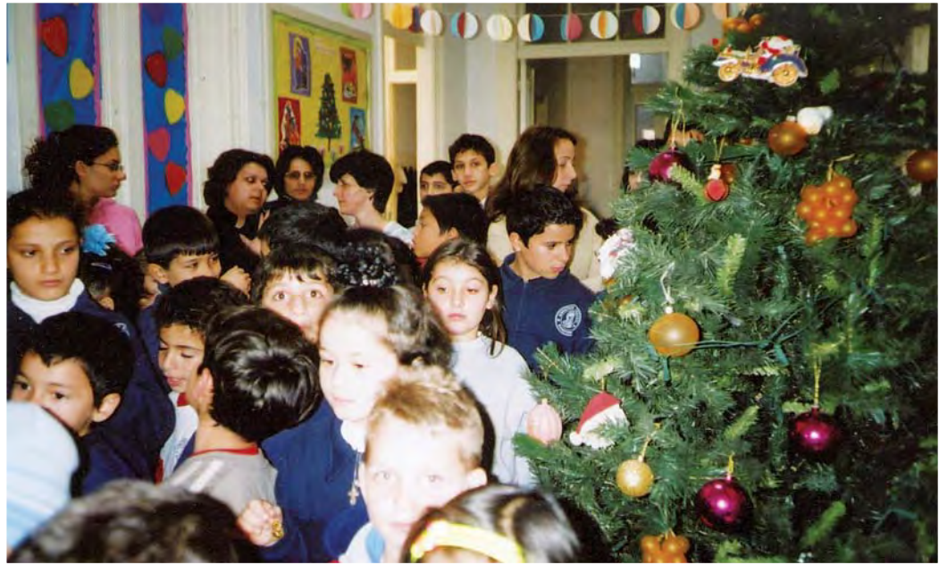
Χριστουγεννιάτικη γιορτή στη Μαθητική Εστία Φανερωμένης.