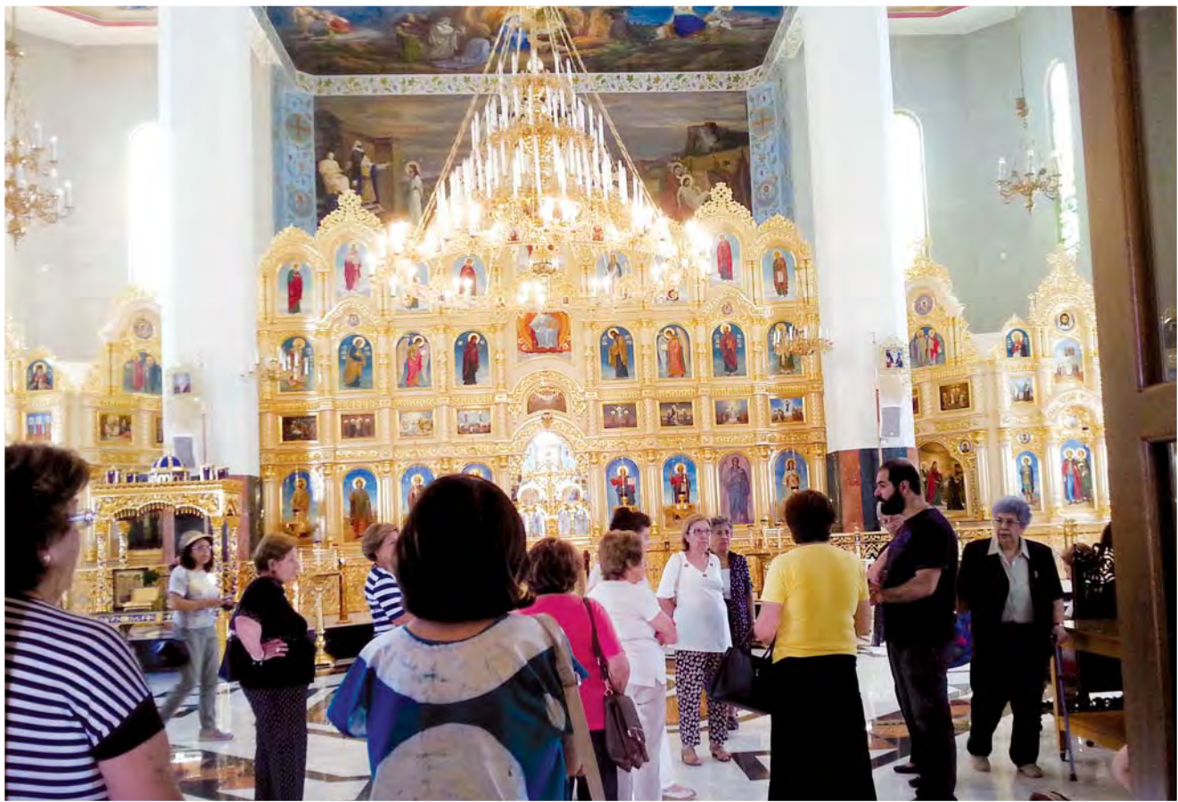
Εκδρομή στο ναό του Αποστόλου Ανδρέα και όλων των εν Ρωσία διαλαμψάντων Αγίων στη Μητρόπολη Ταμασού και Ορεινής στο Επισκοπεϊό (19.06.2017).