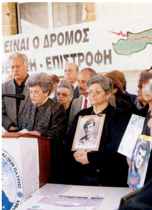
Η Π.Α.Ε.Κ. κοντά στις γυναίκες-συγγενείς Αγνοουμένων που βιώνουν την πιο τραγική πτυχή της τουρκικής εισβολής, στο οδόφραγμα του «Λήδρα Πάλας» (20.06.2001).