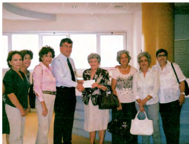
Μέλη του Διοικητικού Συμβουλίου της Π.Α.Ε.Κ. επισκέφθηκαν το Μακάρειο Νοσοκομείο και έκαναν εισφορά για τις ανάγκες του Παιδοογκολογικού Τμήματος.