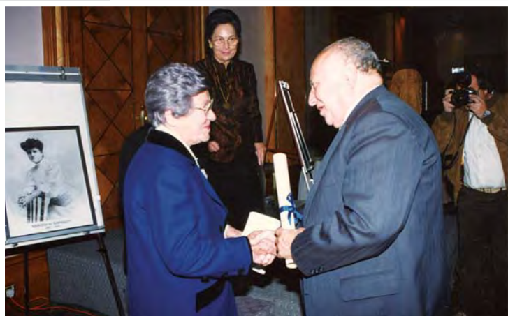
Ο πρόεδρος της Δημοκρατίας κ. Γλαύκος Κληρίδης απονέμει τιμητικό δίπλωμα στην πρόεδρο της Π.Α.Ε.Κ. κ. Μαρούλα Μίτλεττον. Στη φωτογραφία πίσω, η αντιπρόεδρος κ. Ανδρούλα Ηλιοφώτου.