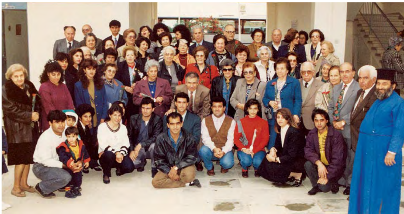
Την Κυριακή, 14.11.1993, το Δημοτικό Σχολείο και η προσφυγική κοινότητα Βρυσούλων φιλοξένησαν κυρίες του Συνδέσμου Φιλίας Ελλάς-Κύπρος που συνοδεύονταν από μέλη της Π.Α.Ε.Κ. Μετά από μια συγκινητική τελετή ακολούθησε δεξίωση.