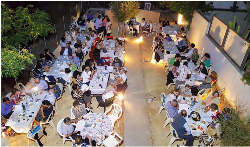
Στιγμιότυπο από τη «Μουσική Βραδιά – αποχαιρετώντας το καλοκαίρι» που οργάνωσε η Π.Α.Ε.Κ., στην αυλή του οικημάτός της για τους φίλους και τα μέλη της (14.10.2015).