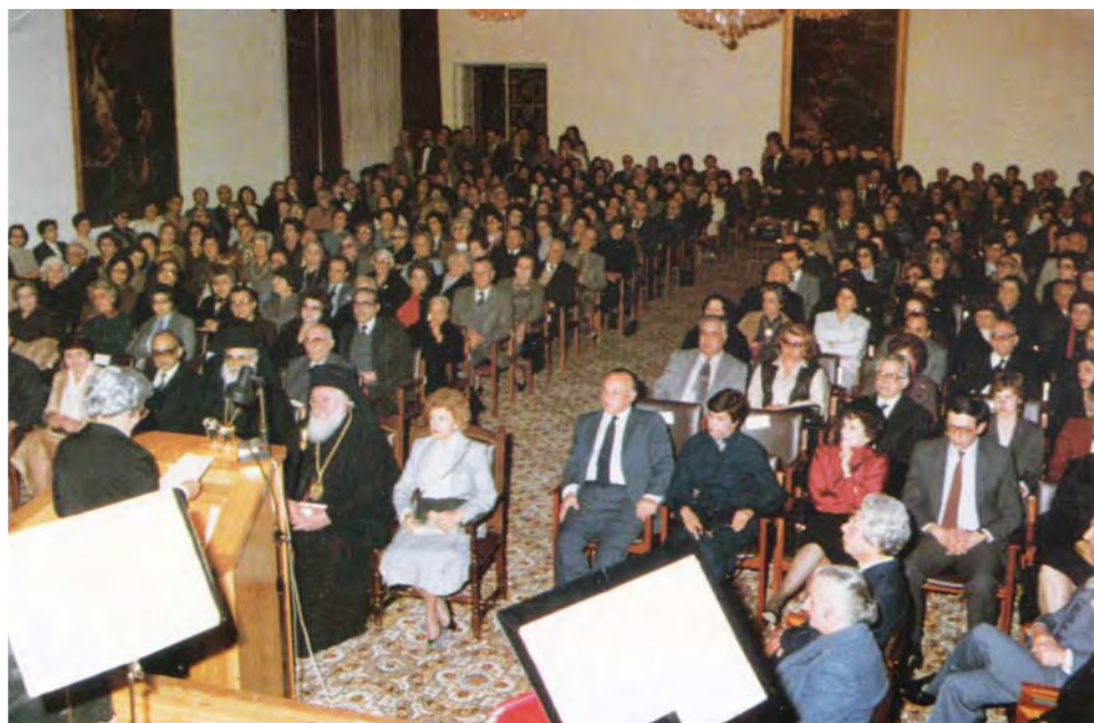
Άποψη του ακροατηρίου στην πιο πάνω εκδήλωση.