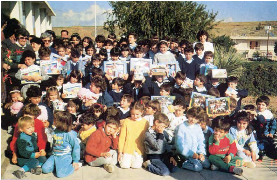
Η Π.Α.Ε.Κ. γιόρτασε την Ημέρα της Μητέρας με τα παιδιά του Δημοτικού Σχολείου στο Ποτάμι, όπου εγκατέστησε τη βιβλιοθήκη που χάρισε στο Σχολείο.