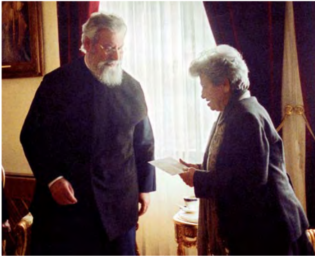
Εισφορά (€1000) στον Μακαριώτατο Αρχιεπίσκοπο κ. Χρυσόστομο για την Πολύτεκνη Μάνα, με την ευκαιρία της Ημέρας της Μητέρας, από την πρόεδρο της Π.Α.Ε.Κ.