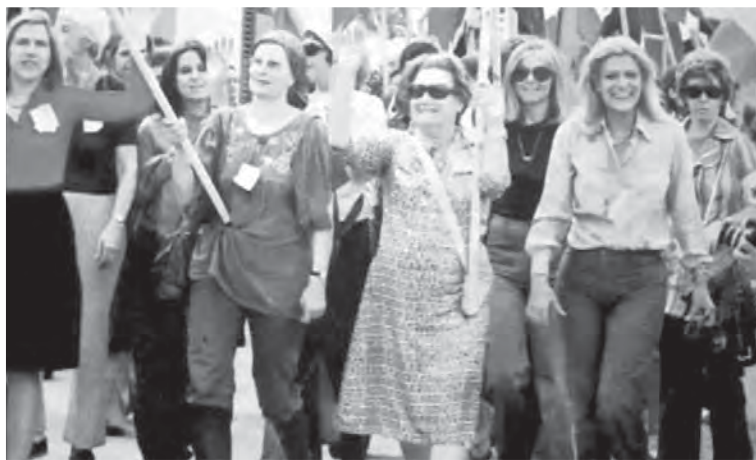
Επί κεφαλής της «Πορείας Γυναικών προς την Αμμόχωστο» η Μελίνα Μερκούρη, η οποία χαρακτηρίστηκε «η πνοή της Πορείας».