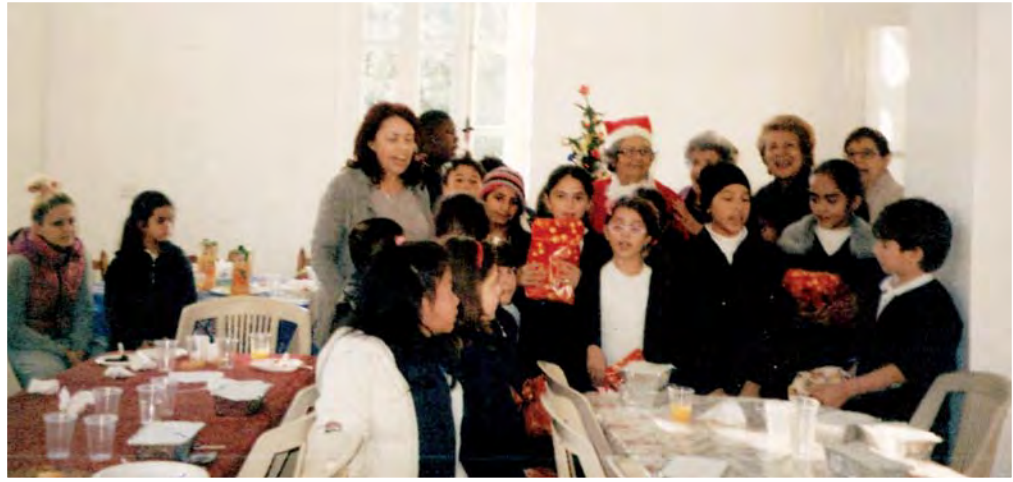
Παιδιά των Δημοτικών σχολείων Έγκωμης και Αγ. Ανδρέα γευματίζουν στο οίκημα της Π.Α.Ε.Κ. και χαίρονται τα χριστουγεννιάτικα δώρα τους.