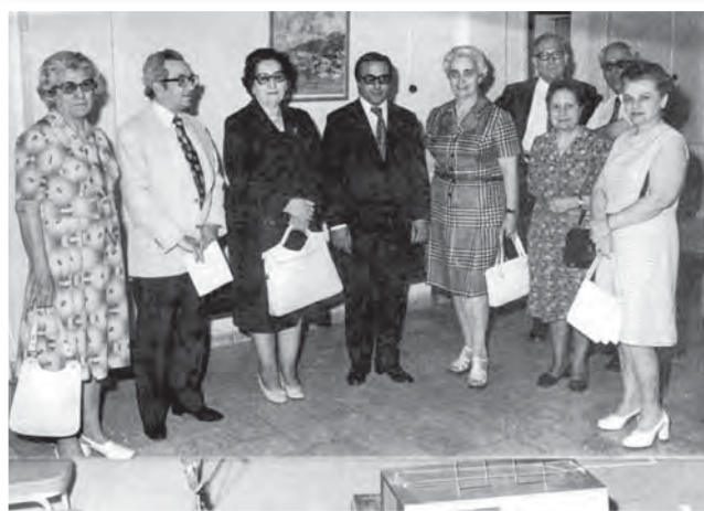
Στιγμιότυπο από την παράδοση δύο θερμοκοιτίδων εκ μέρους του Συνδέσμου Φιλίας Ελλάς-Κύπρος στον Υπουργό Υγείας κ. Χρίστο Βάκη.