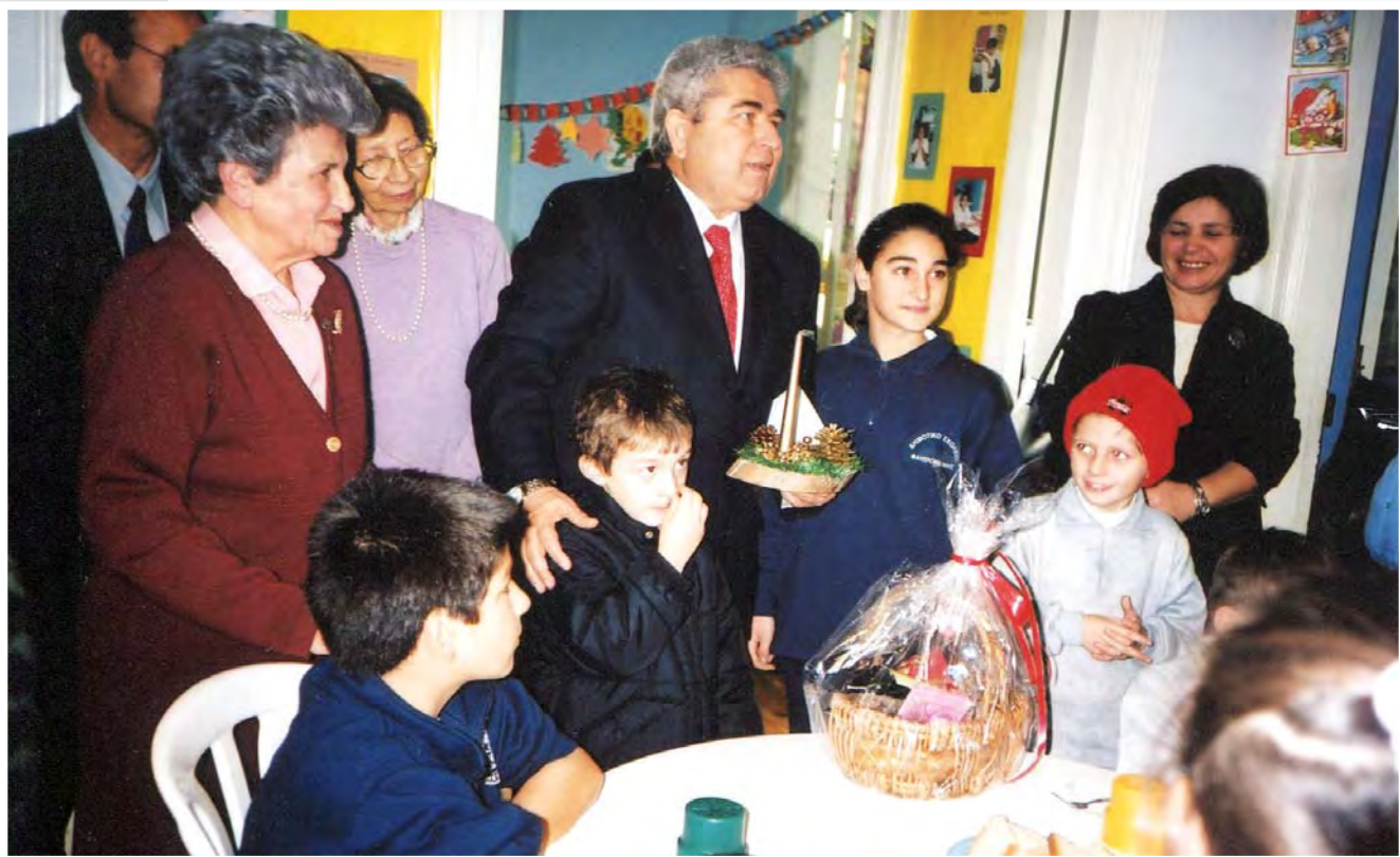
Ο Πρόεδρος της Βουλής κ. Δημήτρης Χριστόφιας μοιράζει δώρα στα παιδιά της Μαθητικής Εστίας Φανερωμένης, πλαισιωμένος από την κ. Μέλια Αβραάμ, Μαρούλα Μαρκίδου και Τζίλντα Κωνσταντινίδου.