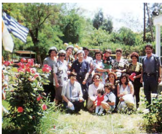
Την ημέρα της Μητέρας το Διοικητικό Συμβούλιο της Π.Α.Ε.Κ. επισκέφτηκε το χωριό Λινού, προσέφερε δώρα στα παιδιά και γιόρτασε μαζί τους.