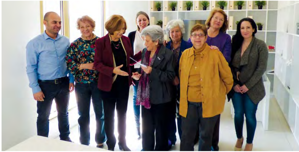
Από την επίσκεψη της Π.Α.Ε.Κ. στο Ίδρυμα «Σύνδεσμος Πρόληψης και Αντιμετώπισης της Βίας στην Οικογένεια (ΣΠΑΒΟ). Η πρόεδρος παραδίδει επιταγή για τις ανάγκες του Συνδέσμου (08.03.2017).