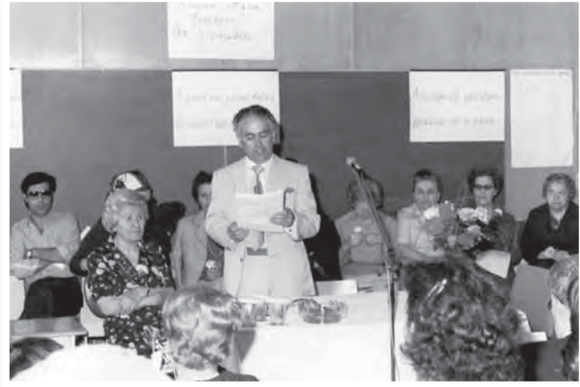
Στιγμιότυπο από τη Γιορτή της Μητέρας που οργάνωσε η Π.Α.Ε.Κ. στο χωριό Πύλα.