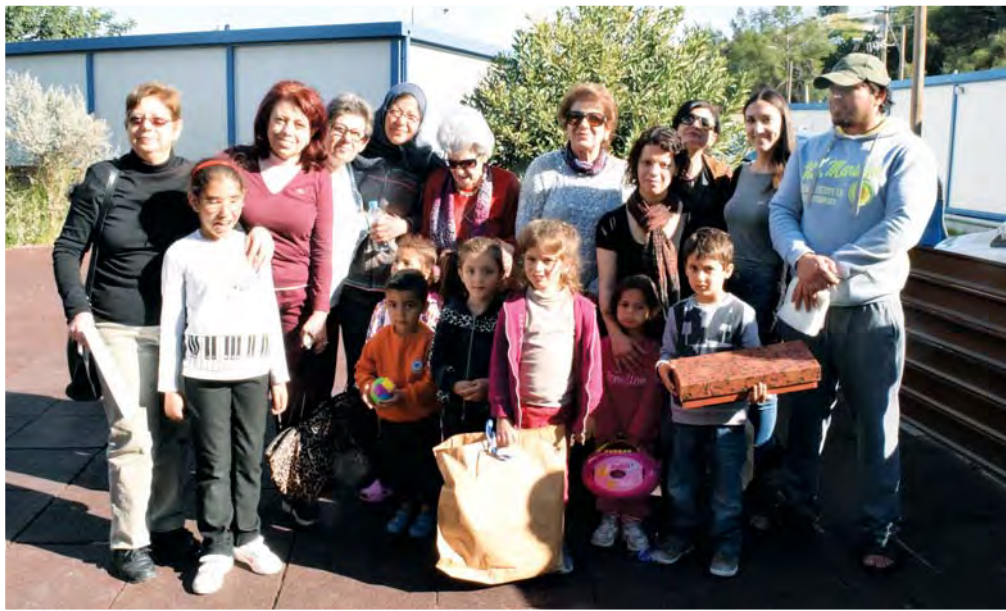
Επίσκεψη της Π.Α.Ε.Κ. στο Κέντρο Υποδοχής Αιτητών Ασύλου στην Κοφίνου, για προσφορά δώρων στα παιδιά (07.03.2016).