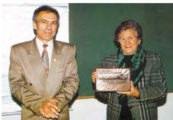
Η πρόεδρος της Π.Α.Ε.Κ. επιδεικνύει το αναμνηστικό δώρο που χάρισε το σχολείο Βρυσούλων στο Σωματείο.