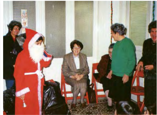
Τα Χριστούγεννα του 1994 η Υπουργός Παιδείας κ. Κλαίρη Αγγελίδου προσέφερε δώρα στα παιδιά της Μαθητικής Εστίας Φανερωμένης και τίμησε με την παρουσία της τη γιορτή τους. Στη φωτογραφία, ο Άγιος Βασίλης φέρνει τα δώρα στην κ. Αγγελίδου, για να τα μοιράσει στα παιδιά.