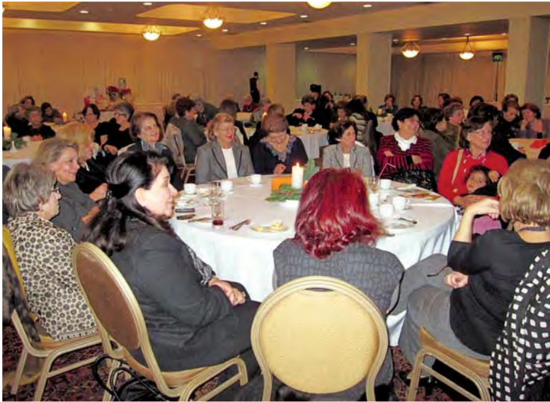
Άποψη του ακροατηρίου στην εκδήλωση για το Έτος Ενεργός Γήρανση και Αλληλεγγύη των Γενεών, ενώ παρακολουθεί το καλλιτεχνικό πρόγραμμα (20.12.2012).