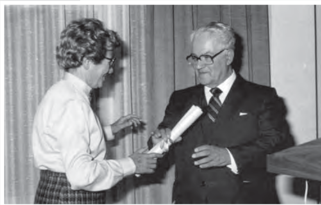
Τιμητική εκδήλωση για τον ποιητή και κορυφαίο συγγραφέα Κύπρο Χρυσάνθη. Η πρόεδρος της Π.Α.Ε.Κ. απονέμει το τιμητικό δίπλωμα.